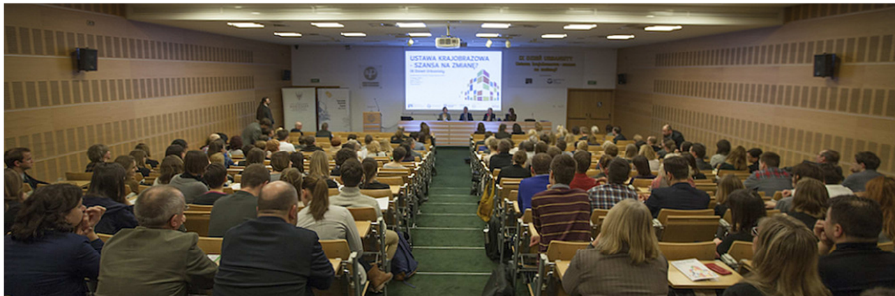
fol. M. Leraczyk

Jak mogliśmy się przekonać, tematyka naszej konferencji doskonale wpisala się w potrzeby przybyłych uczestników. Świadczy o tym wysoka frekwencja w okresie całego wydarzenia oraz aktywny udział słuchaczy w części dyskusyjnej. Zdjęcia z wydarzenia można zobaczyć na naszym profilu Facebook.